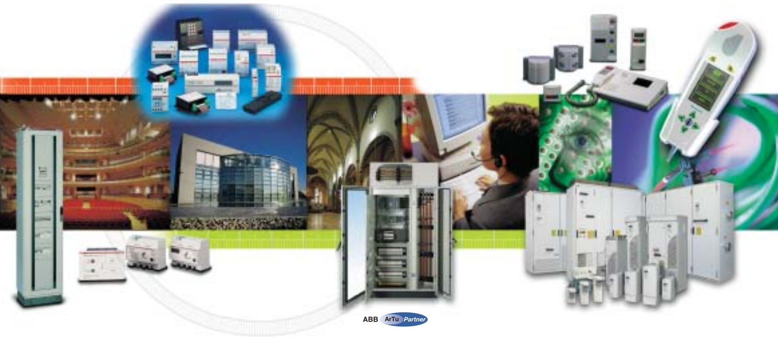
ABB ArTu Partner