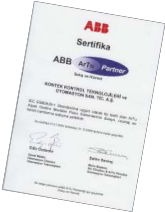
ABB Elektrik Sanayi A.Ş. Otomasyon Teknolojileri Otomasyon Ürünleri